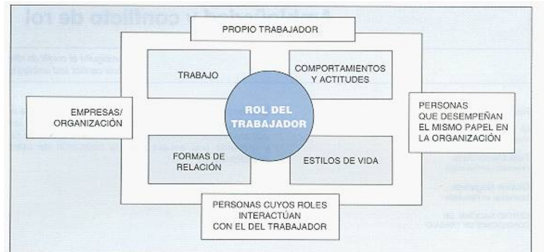
Cuadro 1: Aspectos sobre los que influye el rol y determinantes del rol

Cuando una persona entra a formar parte de una organización, ocupará un puesto en la misma en función del trabajo que vaya a realizar. Esta persona tiene sus propias ideas acerca del papel o rol que debe desempeñar en su puesto. También, otras personas de la organización, o relacionadas con ella, tienen sus propias expectativas acerca del papel o rol que aquella persona debe desempeñar. Tales expectativas pueden expresarse de modo más o menos explícito y concreto. Alguien recién incorporado, poco a poco, va haciéndose una idea de lo que se espera de él y pueden originarse diferentes situaciones.